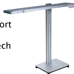
MTF I-Tech Typ IL