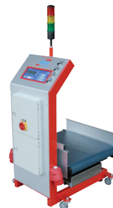
MTF Multi-Scale WT 0-60/20