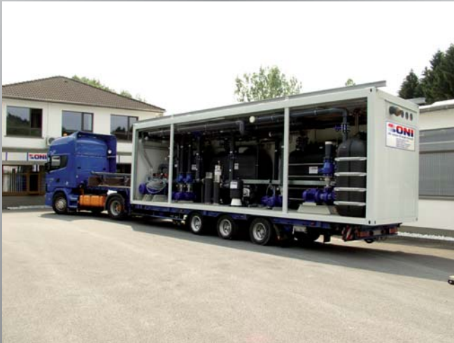
Das erste Modul einer großen Energiezentrale geht auf die Reise zu einem langjährigen, weltweit produzierenden Kunststoffverarbeiter. The first module of a large energy center is on its way to a long-standing plastics processing plant operating worldwide.

Immer mehr Unternehmen in der Welt entscheiden sich für den Einsatz einer modularen Energiezentrale aus dem Hause ONI. Neben der hohen Effizienz und Zuverlässigkeit werden von unseren Kunden die schnelle Verfügbarkeit der Energiedienste, die Flexibilität und die platzsparende Ausführung geschätzt. Der modulare Aufbau bietet zudem den Vorteil einer individuellen Anpassung an die spezifischen Anforderungen hinsichtlich Leistung und Versorgungsspektrum. Für die verschiedenen Anwendungsgebiete stehen Modulbausteine - zur Versorgung mit Kühl- und Kaltwasser, Heizenergie aus Abwärme, Druckluft, Stoffen zur Wasserbehandlung oder aufbereitetem Wasser für die Netz-Nachspeisung - zur Verfügung. Der konstruktive Aufbau unserer Energiezentralen besticht durch eine klare Gliederung, Funktionalität und gute Zugänglichkeit aller Komponenten. Faktoren, die im Hinblick auf Wartungsarbeiten oder den Fall einer Anlagenerweiterung sehr wichtig sind. Für die Planung der Energiezentralen steht unserem Mitarbeiterstab in der Konstruktion daher auch modernste Technik zur Verfügung. So zum Beispiel extrem leistungsstarke Rechner mit CAD-Programmen zur dreidimensionalen Darstellung der Anlagentechnik an Doppelbildschirm-Arbeitsplätzen.