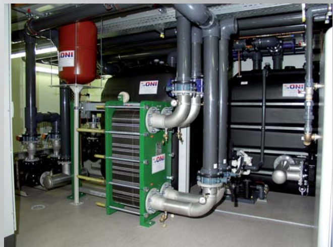
Blick in eine große, modulare Energiezentrale mit Pumpen-/Tankeinheit und Wärmeaustauschereinheit zur Systemtrennung. View of a large modular energy center with pump/tank unit and heat exchanger for system separation.

This is an additional reason for deciding on an ONI energy center which is equipped with state-of-the-art and energy-saving technology. To this effect, the solutions for reducing energy costs are manifold. For example, the power costs for operating chillers can be reduced up to 85 % by the use of a so-called winter relief. This technology simply uses the outdoor air as costfree cooling power during the transitional and winter months. Using an ONI heat recovery system reduces the heating costs for fuel oil or gas by up to 95 %. In this case dissipated heat available cost-free from the cooling circuits is converted to heating power which saves a lot of money. In addition, the use of especially power-efficient chillers, pumps, hydraulic systems and a proprietary software for system optimization reduce the power costs.