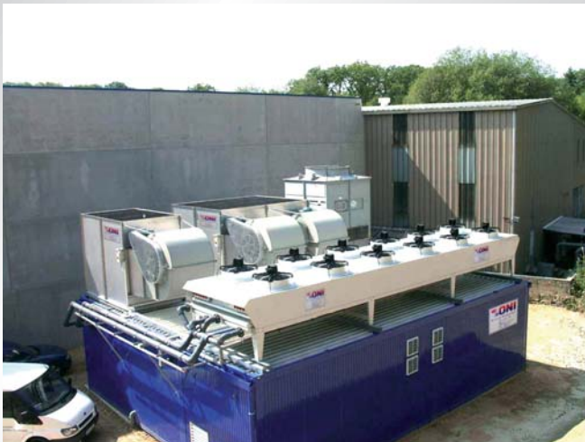
Doppelmodul-Energiezentrale für mehrere Kühlkreisläufe bei einem Kunststoffverarbeiter in Luxemburg. Double-module energy center for several cooling circuits in a plastics processing plant in Luxembourg.

Danach heißt es dann nur noch: Aufstellen, anschließen, fertig!