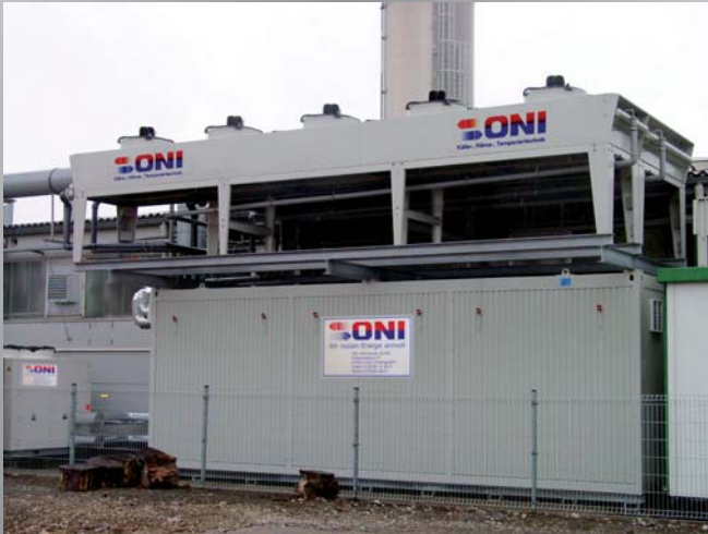
Zentralmodul einer Energiezentrale mit aufgesetzten, glykolfreien Freikühlern für ein Zweikreis-Kühlsystem mit Winterentlastung. Central module of an energy center with glycol-free outdoor coolers on the top for a double-circuit cooling system with winter relief.

Die sichere Versorgung mit Energie und den verschiedenen Medien hat in Produktionsbetrieben höchste Priorität! Die kontinuierlich steigenden Energiekosten gewinnen jedoch zunehmend an Bedeutung. Nur wer auch seine Energiekosten möglichst niedrig hält, schafft jetzt und in der Zukunft gute Wettbewerbsbedingungen für sein Unternehmen. Ein Grund mehr, sich für eine modulare Energiezentrale von ONI zu entscheiden, die mit modernster, energiesparender Technik ausgerüstet wird. Die technischen Lösungen zur Reduzierung von Energiekosten sind dabei vielfältig. So lassen sich beispielsweise durch den Einsatz einer so genannten Winterentlastung die Stromkosten für den Betrieb von Kältemaschinen um bis zu 85 % reduzieren. Bei dieser Technik nutzt man in den Übergangs- und Wintermonaten einfach die Außenluft als kostenlose Kühlenergie. Durch den Einsatz einer ONI-Wärmerückgewinnung lassen sich die Heizkosten für Heizöl oder Gas um bis zu 95 % senken. In diesem Fall wird kostenlos zur Verfügung stehende Abwärme aus Kühlkreisläufen zu Heizwärme, die viel Geld spart. Darüber hinaus lassen sich die Stromkosten durch den Einsatz besonders energieeffizienter Kältemaschinen, Pumpen, Hydrauliksysteme und einer von uns entwickelten Software zur Systemoptimierung reduzieren.