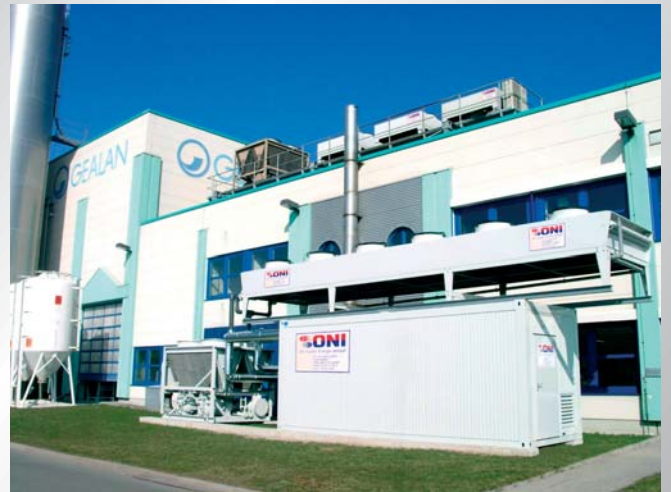
Beispiel für eine modulare Energiezentrale bei einem Kunststoffverarbeiter aus dem Bereich Profillextrusion. Example of a modular energy center in a plastics processing plant for the section extrusion area.

During the construction phase of a new production plant or in a running project requiring a rehabilitation of the system technology the time factor is of paramount importance. Production has to be started as quickly as possible or with the shortest possible interruption since the delivery terms must be complied with. Of course, special attention must be paid to the energy supply as nothing will move without energy!