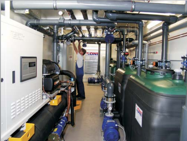
Blick in eine modulare Energiezentrale mit einer innenliegenden, hoch effizienten, wassergekühlten und ölfreien Turbo-Unit Kältemaschine. View to a modular energy center with an interior, highly efficient, watercooled and oil-free Turbo Unit chiller.

Für die Anlagentechnik einer energieeffizienten Kühlwasserversorgung mit Kälteerzeugern und Pumpen-/Tankeinheiten für zwei Kühlkreise mit unterschiedlichen Temperaturebenen sowie dazugehöriger Schaltschrankeinheit ist einiges an Platz notwendig. Entsprechend größer fällt der Platzbedarf aus, wenn zusätzlich eine Druckluft- sowie Heizwärmeversorgung über kostenlose Abwärme aus Kühlkreisen, eine Winterentlastung von Kältemaschinen und eine Wasseraufbereitung erforderlich ist. Bei Inhaus-Anlagen müssen im Unternehmen daher geeignete Räumlichkeiten zur Verfügung stehen, die ausreichend bemessen sind. Diese Flächen sind jedoch knapp und kostbar. Man möchte stattdessen lieber jeden freien Quadratmeter mit einer Produktionsmaschine oder der notwendigen Peripherie belegen. Der Widerspruch, dass die Energie- und Medientechnik zwar unbedingt benötigt wird, jedoch im besten Fall keinen Platz einnehmen soll, lässt sich durch den Einsatz unserer modularen Energiezentralen in idealer Form auflösen. Die gesamte Technik, die üblicherweise in einem Raum des Gebäudes untergebracht wird, findet in einem transportablen Technikraum Platz, der im Außenbereich des Unternehmens aufgestellt wird. Die Komponenten wie Freikühler, Kühltürme oder Kältemaschinen werden im Umfeld aufgestellt.