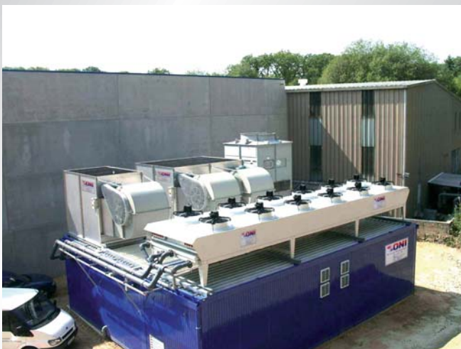
Doppelmodul-Energiezentrale für mehrere Kühlkreisläufe bei einem Kunststoffverarbeiter in Luxemburg. Double-module energy center for several cooling circuits in a plastics processing plant in Luxembourg.

Danach heißt es dann nur noch: Aufstellen, anschließen, fertig!