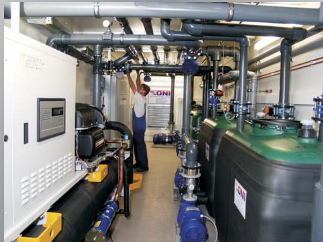
Blick in eine modulare Energiezentrale mit einer innenliegenden, hoch effizienten, wassergekühlten und ölfreien Turbo-Unit Kältemaschine. View to a modular energy center with an interior, highly efficient, watercooled and oil-free Turbo Unit chiller.

Für die Anlagentechnik einer energieeffizienten Kühlwasserversorgung mit Kälteerzeugern und Pumpen-/Tankeinheiten für zwei Kühlkreise mit unterschiedlichen Temperaturebenen sowie dazugehöriger Schaltschrankeinheit ist einiges an Platz notwendig. Entsprechend größer fällt der Platzbedarf aus, wenn zusätzlich eine Druckluft- sowie Heizwärmeversorgung über kostenlose Abwärme aus Kühlkreisen, eine Winterentlastung von Kältemaschinen und eine Wasseraufbereitung erforderlich ist. Bei Inhaus-Anlagen müssen im Unternehmen daher geeignete Räumlichkeiten zur Verfügung stehen, die ausreichend bemessen sind. Diese Flächen sind jedoch knapp und kostbar. Man möchte stattdessen lieber jeden freien Quadratmeter mit einer Produktionsmaschine oder der notwendigen Peripherie belegen. Der Widerspruch, dass die Energie- und Medientechnik zwar unbedingt benötigt wird, jedoch im besten Fall keinen Platz einnehmen soll, lässt sich durch den Einsatz unserer modularen Energiezentralen in idealer Form auflösen. Die gesamte Technik, die üblicherweise in einem Raum des Gebäudes untergebracht wird, findet in einem transportablen Technikraum Platz, der im Außenbereich des Unternehmens aufgestellt wird. Die Komponenten wie Freikühler, Kühltürme oder Kältemaschinen werden im Umfeld aufgestellt.