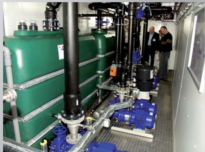
Abnahme einer modularen Energiezentrale, durch Fachleute unseres Kunden, nach Fertigstellung im ONI-Werk in Lindlar. Acceptance of a modular energy center by experts of our customer after completion in the Lindlar ONI plant.

The plant equipment of an energy-efficient cooling water supply with chillers and pump-/tank units for two cooling circuits for different temperature levels as well as the associated switchgear cabinet will require some space. The space requirement will be higher if a compressed-air as well as heating power supply via costfree waste heat from the cooling circuit, a chiller winter relief and water treatment are additionally needed. In case of in-house systems the company must therefore provide suitable space which is sized correspondingly. However, this space is rare and valuable. Instead, it would be preferred to provide each square meter of free space for a production machine or the required peripherals. The contradiction that energy and fluid equipment is necessary but should not occupy any space at best can be solved ideally by the use of our modular energy centers. The entire equipment, normally housed in a room of a building, ties up space in a removable technical room which is installed in the outdoor area of the company. The components such as outdoor coolers, cooling towers or chillers will be installed in the environment.